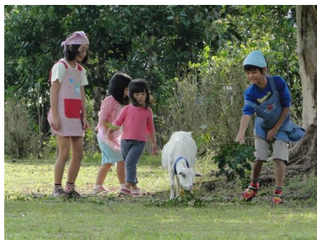
みんなでちょっと休憩 ゆったりとした時間が流れてます