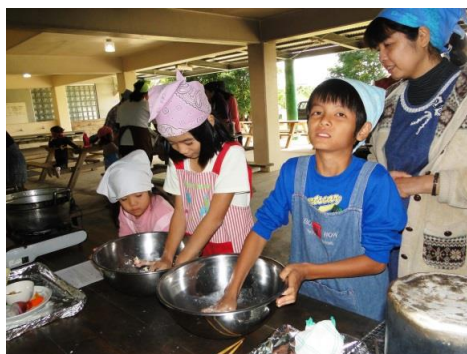
みんなピザ生地作り初体験です