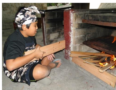
火おこしていろんなことを学んでくれたかな