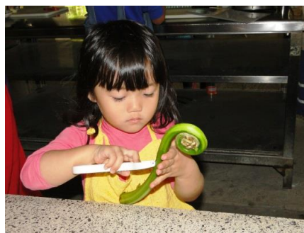
これがヒカゲヘゴですね 前勢岳の野草料理にも挑戦です