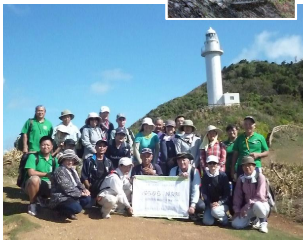
↑ おとといの大雨がウソのよう。からりと晴れ渡り、みんないい汗をかきました。