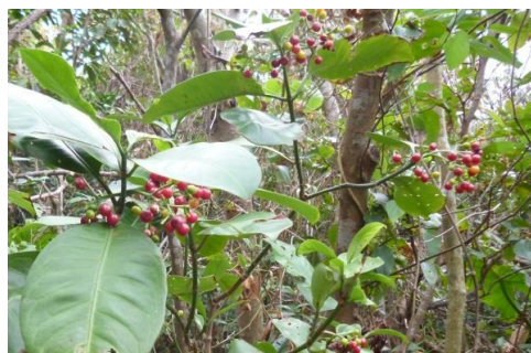
← 黄緑、黄、橙、赤、紫、ボチョウジの実がきれいに色づいています。