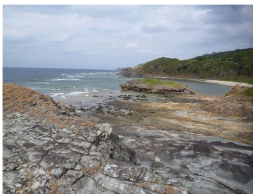
← 西表島にいるような錯覚を覚える、雄大な屋良部半島の風景